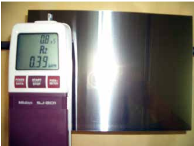
面精度 Rz 0.39 (profile irregularity)

Taise is dealing with polishing various materials such as Quartz, Sapphire, Teflon, Ruby, Aluminum, Cemented Carbide, etc.