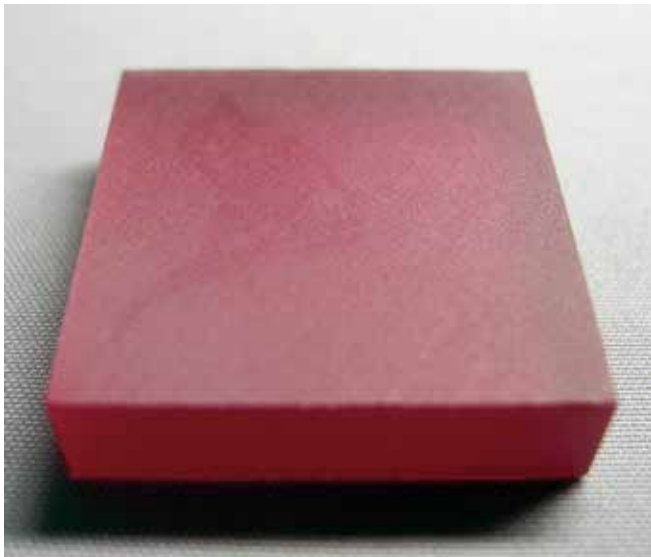
Ruby ルビー 20×20 mm t5 mm