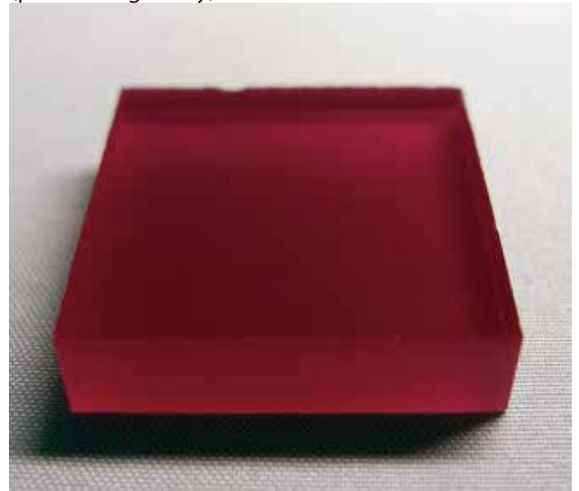
面精度 1/2 \mu m ダイヤモンド砥粒仕上 (profile irregularity)※ポリッシュも対応致します。