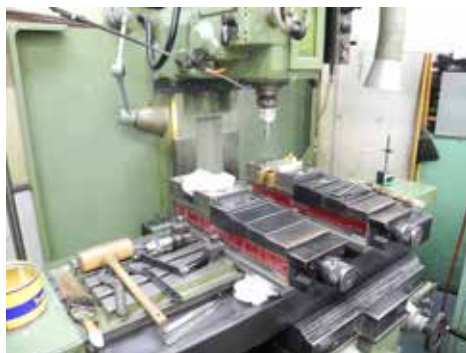
NC Milling Machine NC フライス盤