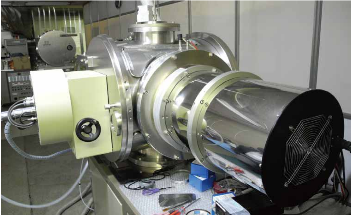
Ion Milling Device イオンミリング装置