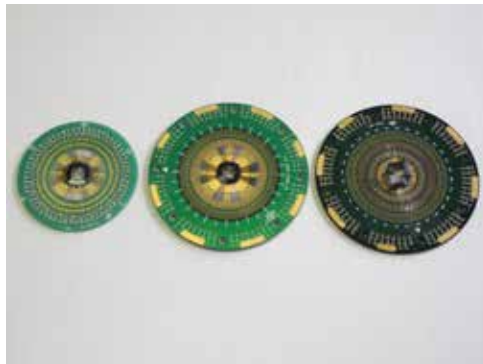
Probe Card プローブカード