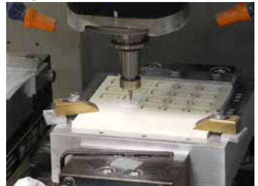
Ceramics Processing セラミック加工

タイセイでは金属・セラミック加工を承ります。また、プローブカードやイオンミリング装置などもお客様のニーズに合わせて製作可能です。